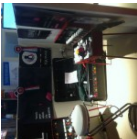
Equita Lyon 2015 – EQUINAIL